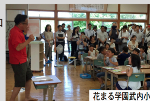
花まる学園武内小